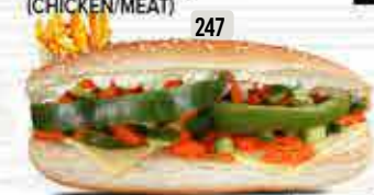
247 DHS. 9.00 كومبو خضار VEGETABLE COMBO