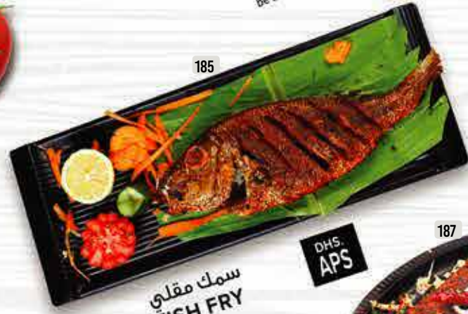
185 سمك مقلي FISH FRY