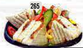
265 كلوب ايطالي Italian Club DHS. 14.00