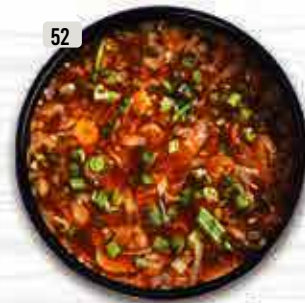
شوربة حار و حامض (دجاج/خضار) Hot & Sour Soup (Chi./Veg.) DHS. 10.00