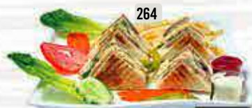
264 كلوب اسباني Spanish Club DHS. 14.00