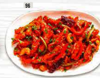
96 دراجون دجاج / لحم بقر Dragon Chicken / Beef DHS. 24.00