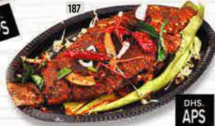
187 DHS. APS بوليشات سمك FISH POLLICHATHU