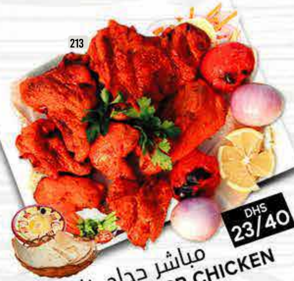
213 مباشير دجاج خاص MUBASHIR SP CHICKEN