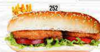
252 DHS. 12.00 كومبو فيليه سمك FISH FILLET COMBO