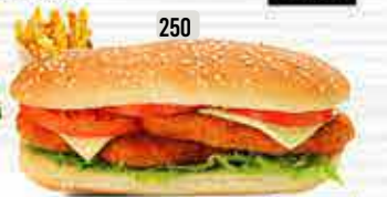
250 DHS. 12.00 كومبو دجاج فيليه CHI. FILLET COMBO