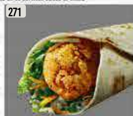
271 راب اسباني Spanish Wrap DHS. 13.00