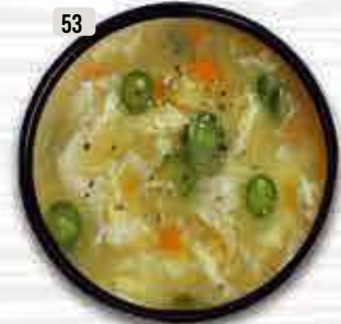
شوربة حلو ذرة (دجاج/خضار) Sweet Corn Soup (Chi./Veg.) DHS. 10.00

SOUP IS A PRIMARILY LIQUID FOOD, GENERALLY SERVED WARM OR HOT (BUT MAY BE COOL OR COLD). THAT IS MADE BY COMBINING INGREDIENTS OF MEAT OR VEGETABLES WITH STOCK, MILK, OR WATER. HOT SOUPS ARE ADDITIONALLY