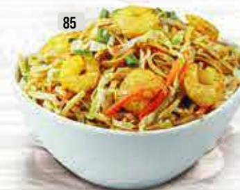
85 نودلز روبيان Prawns Noodles DHS. 23.00