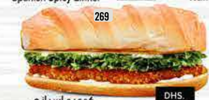
269 كومبو اسباني Spanish Combo DHS. 13.00