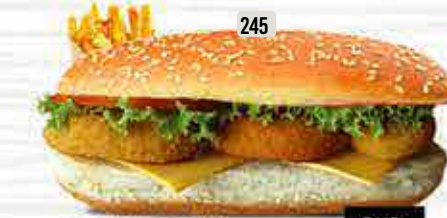
245 DHS. 11.00 كومبو روبان جمبو JUMBO PRAWNS COMBO