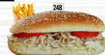
248 DHS. 10.00 كومبو مايونيز دجاج CHI. MAYO COMBO