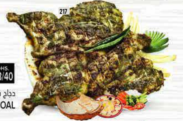
217 دجاج فلفل أخضر على الفحم GREEN CHILLI CHARCOAL