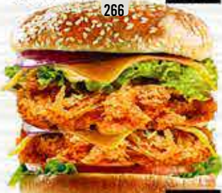
266 زنجر اسباني حار Spanish Spicy Zinker DHS. 16.00