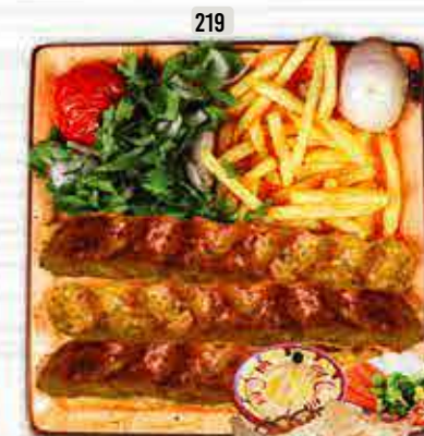
219 كباب دجاج CHICKEN KABAB