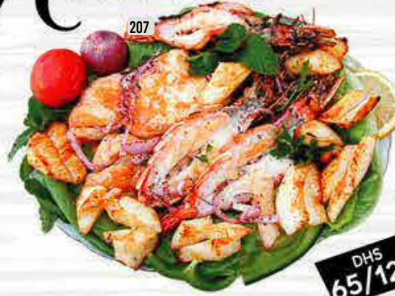
207 مشكل بحرية SEAFOOD MIX