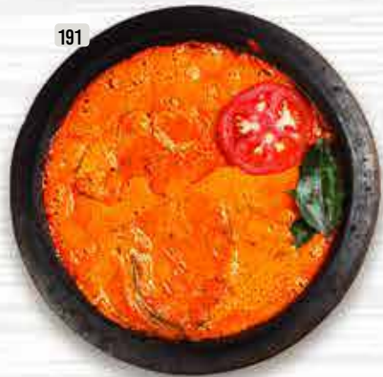
191 DHS. APS سمك شاتي كاري FISH CHATTY CURRY