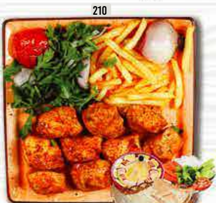
210 دجاج تكا CHICKEN TIKKA