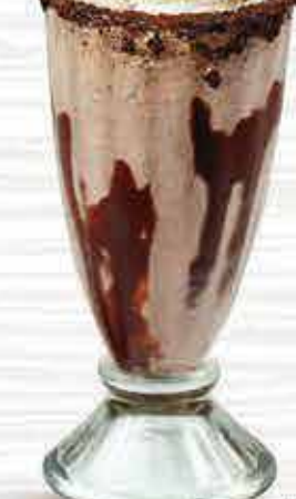
378 اوريو حليب شيك Oreo Milk Shake DHS. 10/13