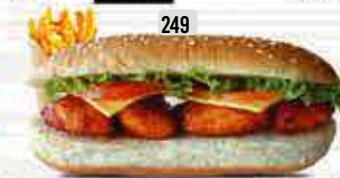
249 DHS. 12.00 كومبو تگا خاص TIKKA SPECIAL COMBO