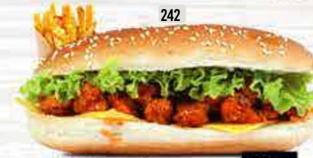
242 DHS. 12.00 كومبو دجاج فلفل CHI. CHILLI COMBO