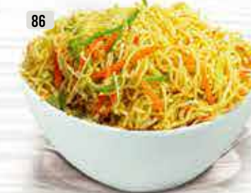
86 نودلز خضار / بيض Veg / Egg Noodles DHS. 13.00