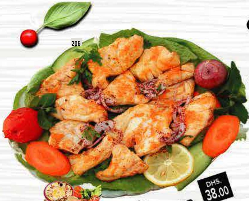
206 هامور مشوي GRILLED HAMOUR