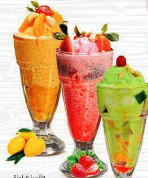
388 فالودا فراولة Strawberry Falooda DHS. 13.00