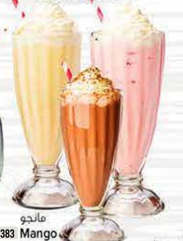
383 مانجو Mango DHS. 8/11/13