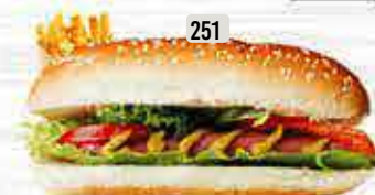
251 DHS. 10.00 كومبو نقانق HOTDOG COMBO