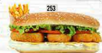
253 DHS. 12.00 كومبو قطع NUGGETS COMBO