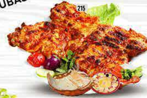
215 دجاج على الفحم CHICKEN CHARCOAL