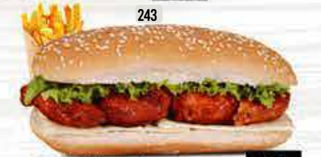
243 DHS. 12.00 كومبو شيش طاووق SHISH TAWOOK COMBO