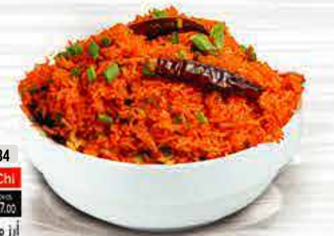
82 Veg 14.00 83 Egg 14.00 84 Chi 17.00 أرز مقلي شيزوان Schezwan Fried Rice