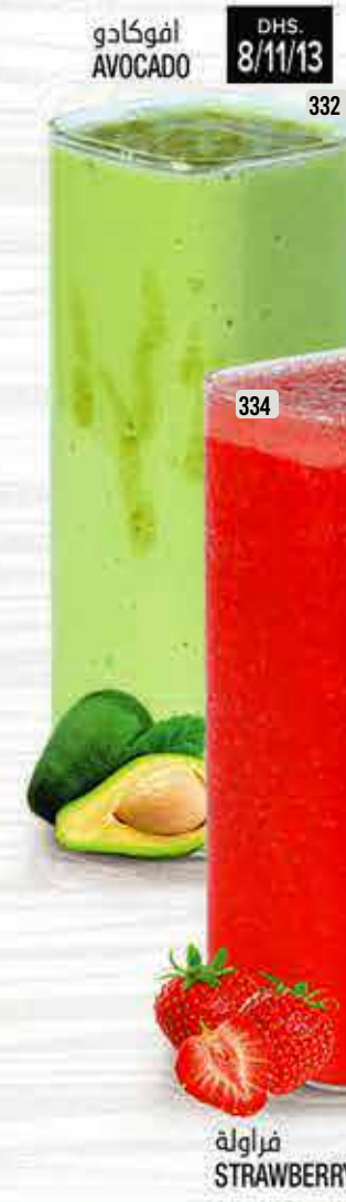
افوكادو AVOCADO DHS. 8/11/13 332