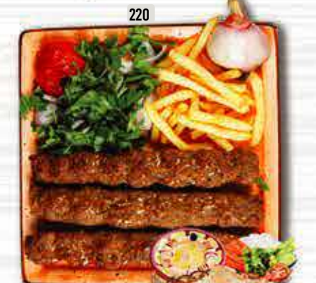
220 كباب لحم MUTTON KABAB