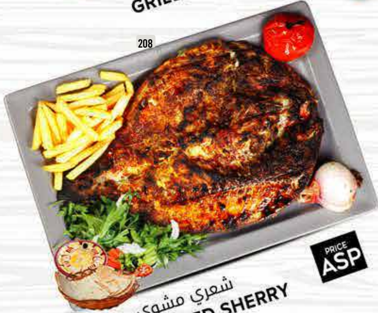
208 شعري مشوي GRILLED SHERRY