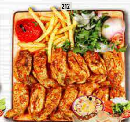
212 أجنحة دجاج CHICKEN WINGS