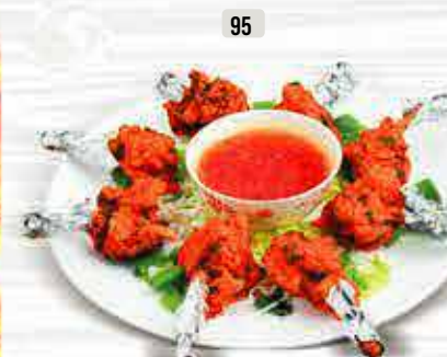
95 دجاج لوليبوب (10 قطع) Chicken Lollipop (10 ps) DHS. 15.00