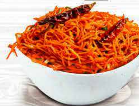
87 Veg 14.00 88 Egg 14.00 89 Chi 17.00 نودلز شيزوان Schezwan Noodles

NOODLES ARE A TYPE OF FOOD MADE FROM WHEATGLUTEN DOUGH WHICH IS STRETCHED FLAT AND CUT, STRETCHED, OR EXTRUDED, INTO LONG STRIPS OR STRINGS. NOODLES ARE A STAPLE FOOD IN MANY CULTURES AND MADE INTO A VARIETY OF DISHES.