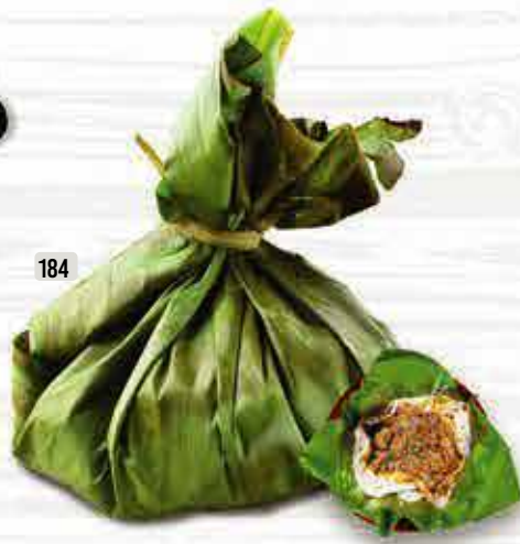
184 DHS. 15/18 كيجي براتا KIZHI POROTA (Beef, Chicken)

Never underestimate the power of good food. Eating delicious Food Can be a Life Changing Experience Shon Mehta