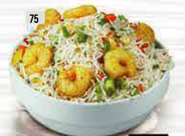
75 أرز مقلي روبيان Prawns Fried Rice DHS. 23.00