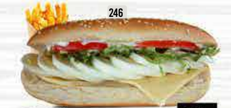
246 DHS. 8.00 كومبو بيض EGG COMBO