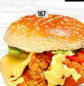
167 برجر ايطالي Italian Burger DHS. 13.00