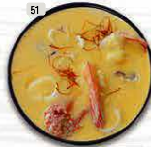
شوربة بحرية Seafood Soup DHS. 13.00