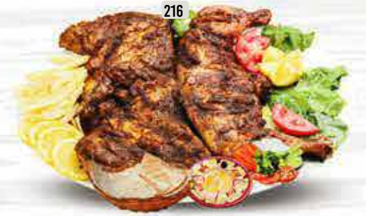
216 دجاج فلفل اسود على الفحم PEPPER CHARCOAL