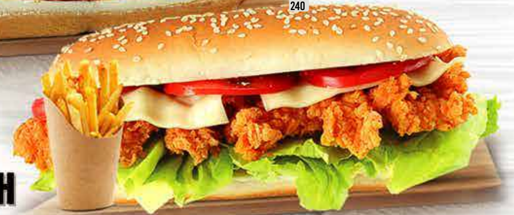
240 DHS. 12.00 كومبو زنجير ZINGER COMBO