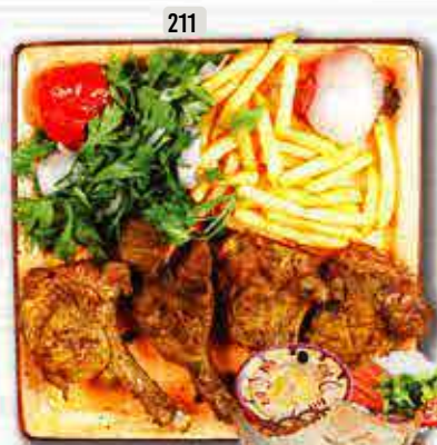
211 ریش LAMB CHOPS