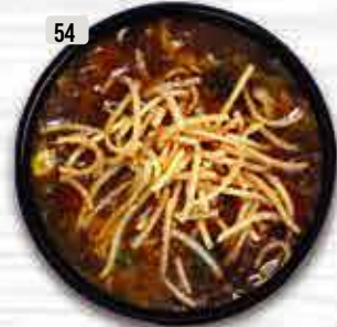
شوربة مانشو (دجاج/خضار) Manchow Soup (Chi./Veg.) DHS. 10.00