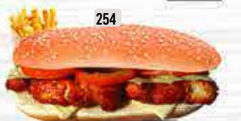
254 DHS. 12.00 كومبو كاجون CAJUN COMBO