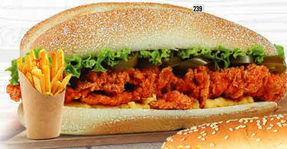
239 DHS. 13.00 كومبو برق و رعد BARQ WA RAAD COMBO