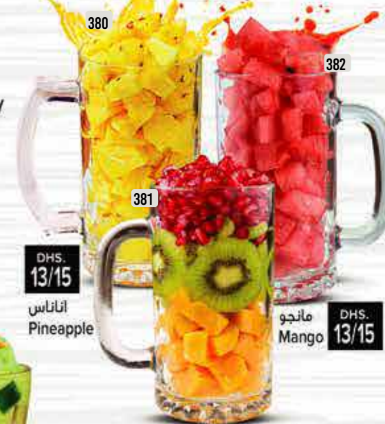
380 اناناس Pineapple DHS. 13/15