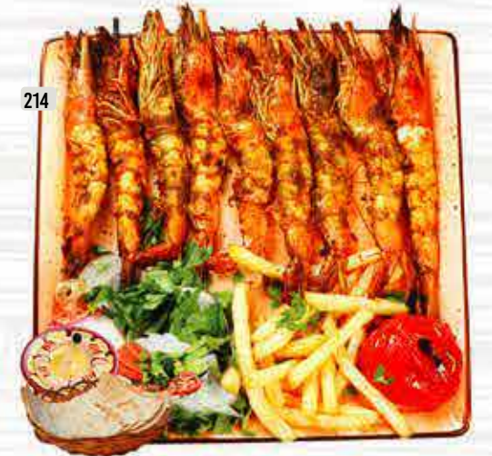
214 روبيان مشوي GRILLED PRAWNS