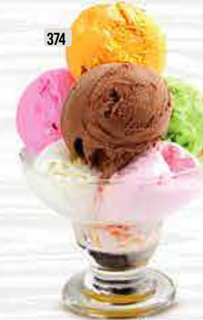
374 ايس كريم مشكل Mixed Ice Cream DHS. 8/10/13