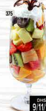
375 سلطة فواكه مع ايس كريم Fruit Salad w. Ice Cream DHS. 9/11/13