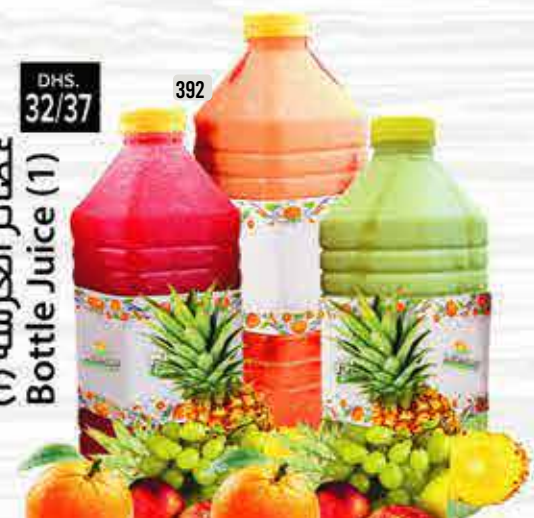
392 DHS. 32/37