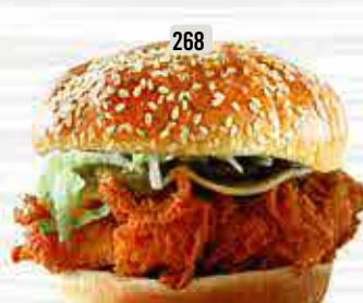
268 برجر اسباني Spanish Burger DHS. 13.00