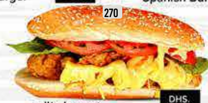
270 كومبو ايطالي Italian Combo DHS. 13.00