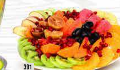
391 صحن فاكهة Fruit Plate DHS. 22/27