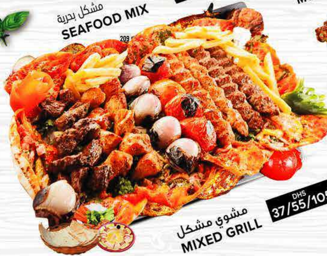
209 مشوي مشكل MIXED GRILL