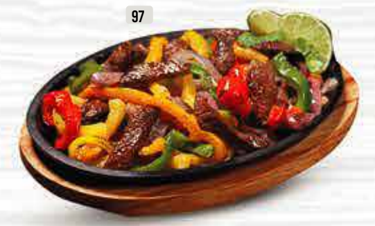
97 سيزلر دجاج / لحم بقر Sizzler Chicken / Beef DHS. 24.00