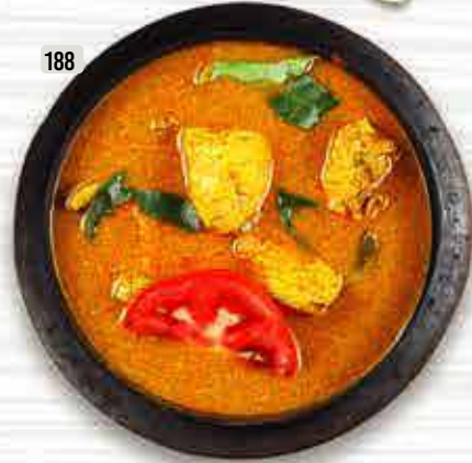
188 DHS. 18/22/25 شاتي كاري CHATTY CURRY Chicken / Beef / Mutton