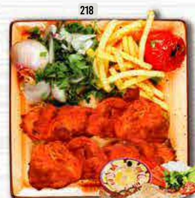
218 لحم تكا MUTTON TIKKA