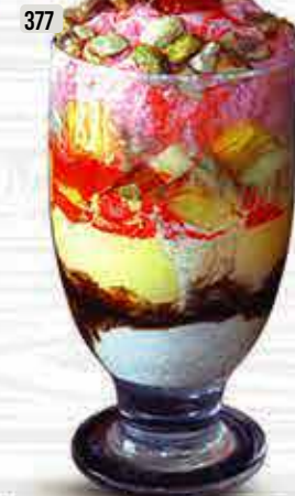
377 جلوري Glory DHS. 15.00