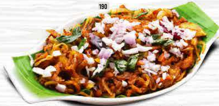
190 DHS. 12/14 كاپا برياني KAPPA BIRIYANI CHI./BEEF