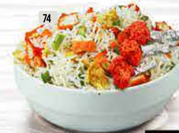
74 أرز مقلي بالدجاج مع دجاج لولبي بوب Chicken Fried Rice With Lollipop Chicken DHS. 25.00