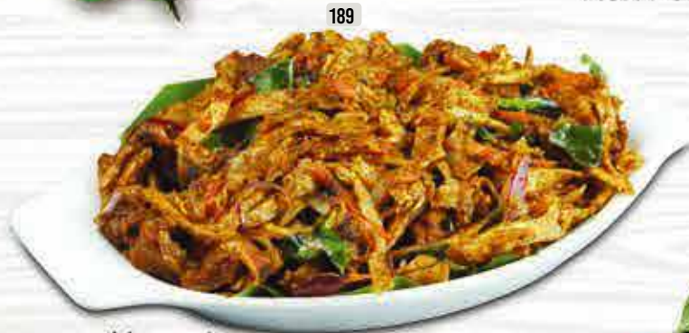
189 DHS. 11/14 كوتو براتا KOTHUPOROTA CHI./BEEF