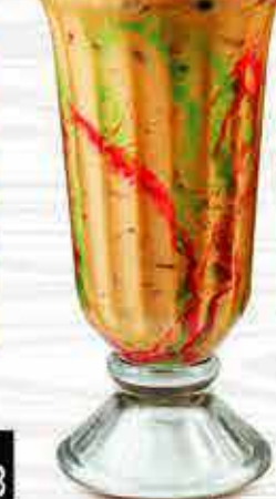
376 فالودة Falooda DHS. 10/13