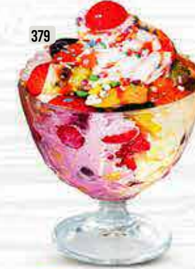
379 توتي فروتي Totty Fruity DHS. 11/13