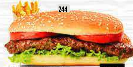
244 DHS. 12.00 كومبو كباب - دجاج / لحم KABAB COMBO (CHICKEN/MEAT)