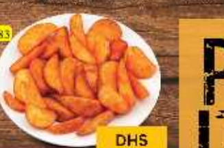
بطاطا وبيجيز POTATO WEDGES DHS 9/12