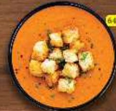
شوربة صم Tomato Soup DHS. 12