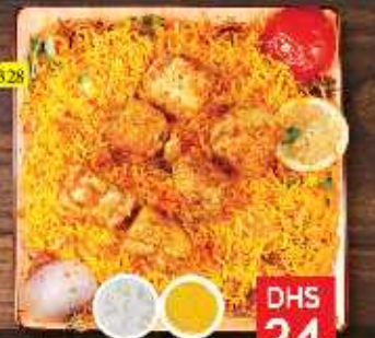
دجاج تكا مع أرز CHI. TIKKA W. RICE DHS 24