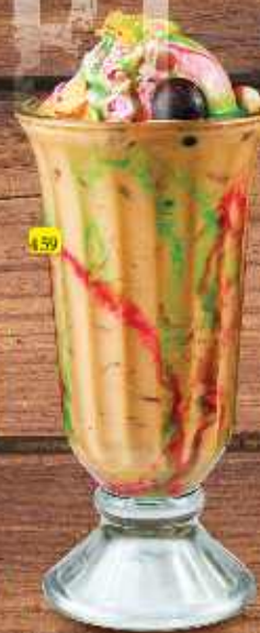
159 Falooda DHS. 12/14