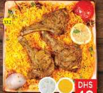
ريش مع أرز LAMP CHOPS W. RICE DHS 40