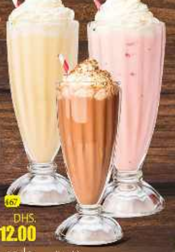
167 Mango Vanilla DHS. 12.00