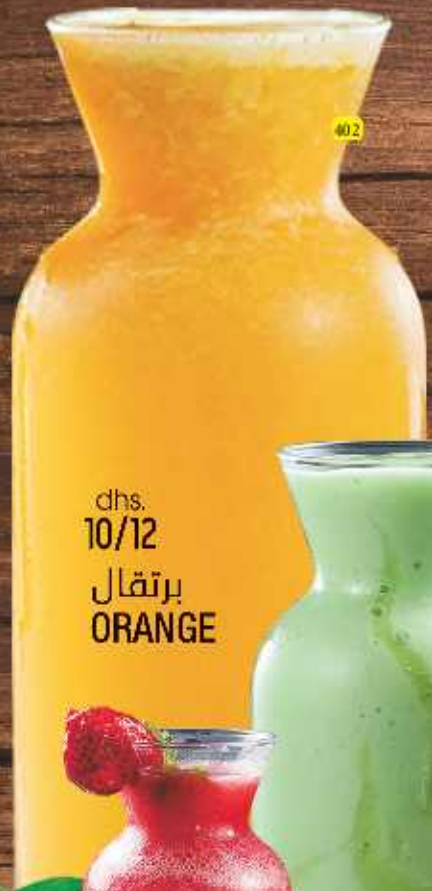
dhs. 10/12 برتقال ORANGE