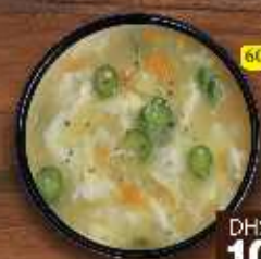
شوربة حلو ذرة (خضار) Sweet Corn Soup (Chi./Veg.) DHS. 10