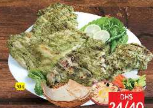
304 دجاج فلفل اخضر على الفحم GREEN CHILLI CHARCOAL