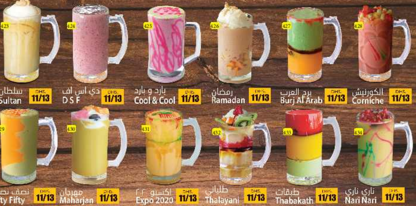
سلطان Sultan DHS. 11/13 دي اس اف D S F DHS. 11/13 بارد و بارد Cool & Cool DHS. 11/13 رمضان Ramadan DHS. 11/13 برج العرب Burj Al Arab DHS. 11/13 الكورنيش Corniche DHS. 11/13 ناري ناري Nari Nari DHS. 11/13 طبقات Thabakath DHS. 11/13 طلياني Thalayani DHS. 11/13 اكستو 2020 Expo 2020 DHS. 11/13 مهراجن Maharjan DHS. 11/13 نصف نصف Fifty Fifty DHS. 11/13