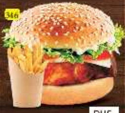
برجر كاجون CAJUN BURGER DHS. 10