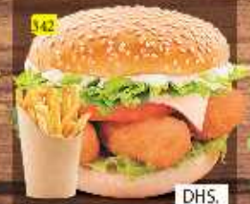
برجر جمبو روبيان JUMBO PRAWNS DHS. 12