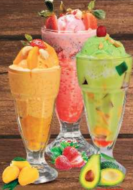
169 Strawberry Falooda DHS. 11/13