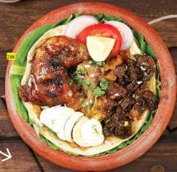
دوم براتا DUM PAROTTA