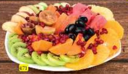
171 Fruit Plate DHS. 22/27