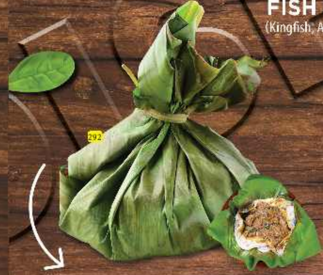
سمك توا خاص FISH SP. TAWA (Kingfish, Avoli, hamour, Sherri.)