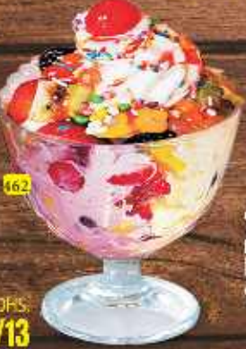
162 Tutty Fruity DHS. 11/13