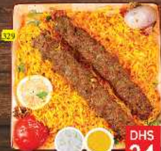
لحم كباب مع أرز MUTTON KABAB W. RICE DHS 24