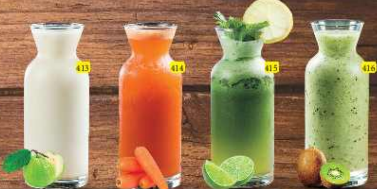
فراولة dhs 10/12 STRAWBERRY جوافة dhs 10/12 GUAVA جزرة dhs 10/12 CARROT ليمون نعناع dhs 9/11 LEMON MINT كيوي dhs 10/12 KIWI