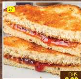
27 CHEESE JAM BUTTER ROASTED DHS. 6.00