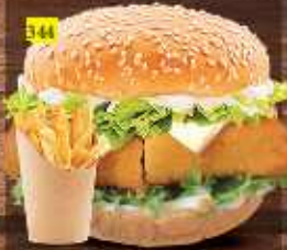
برجر فيليه FILLET BURGER DHS. 10