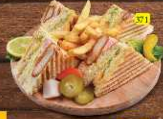
كلوب مباشر Club Mubasher DHS 12