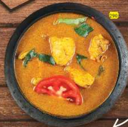
شاتي كاري CHATTY CURRY CHICKEN / BEEF / MUTTON