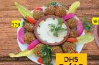
فلافل صحن FALAFEL PLATE DHS 8/12