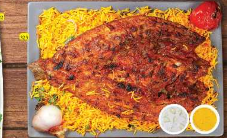
سمك مشوي مع أرز GRILLED FISH WITH RICE HAMMOUR/SHERRY PRICE ASP