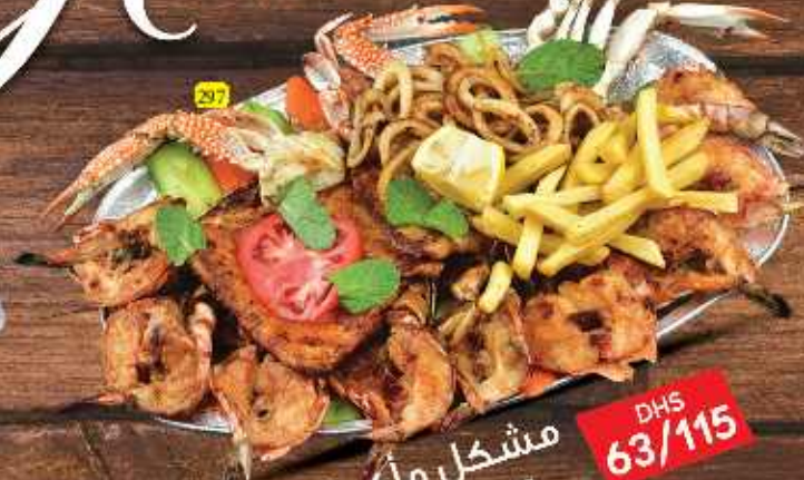
297 مشكل مأكولات بحرية SEAFOOD MIX