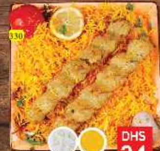
دجاج كباب مع أرز CHI. KABAB W. RICE DHS 24