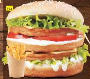
برجر دجاج دبل CHICKEN BURGER DOUBLE DHS. 14