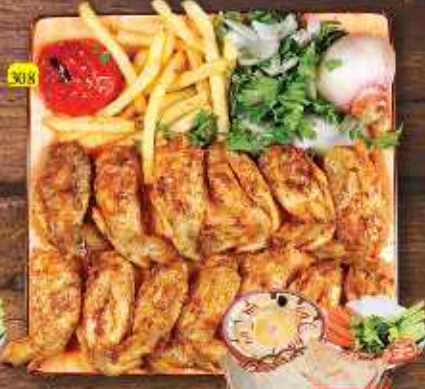
308 جوانه دجاج CHICKEN WINGS