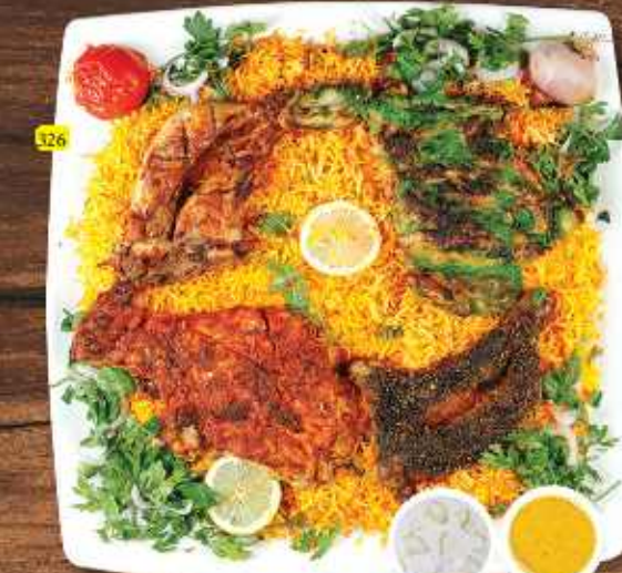
الفحم مشكل مع أرز MIXED CHARCOAL W. RICE DHS 50