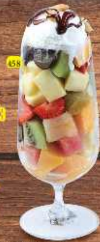
158 Fruit Salad w. Ice Cream DHS. 11/13