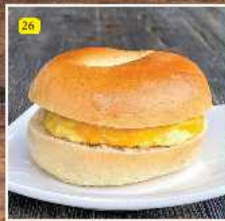
26 EGG WITH CHEESE DHS. 6.00