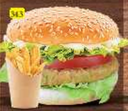
برجر خضار VEG. BURGER DHS. 8