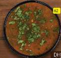
شوربة دجاج فلفل Kozhi Kurumulaku Soup DHS. 10