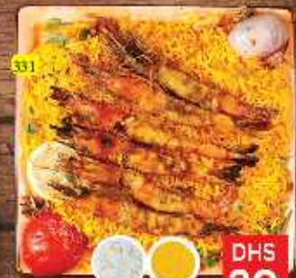
مشوي روبيان مع أرز GRILLED PRAWNS W. RICE DHS 30