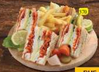
كلوب زنجير / مضافي Zinker/Mathafi Club DHS 14/15