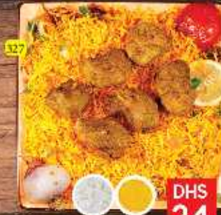
لحم تكا مع أرز MUTTON TIKKA W. RICE DHS 24