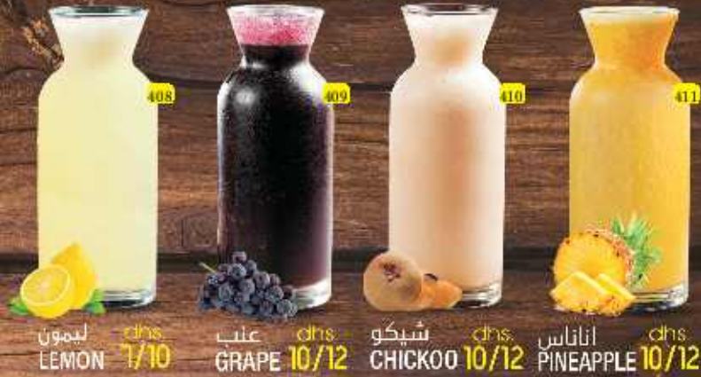
ليمون dhs 7/10 LEMON عنب dhs 10/12 GRAPE شيكو dhs 10/12 CHICKOO اناناس dhs 10/12 PINEAPPLE