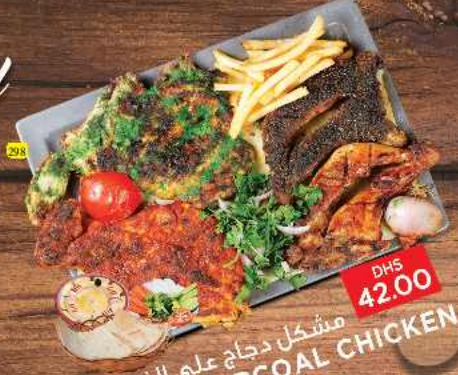
298 مشكل دجاج على الفحم MIX CHARCOAL CHICKEN