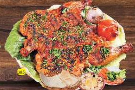
305 دجاج بيري بيري على الفحم PERI PERI CHARCOAL