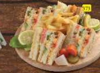
كلوب شاورما Shawarma Club DHS 12