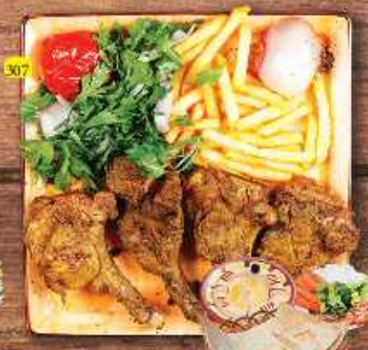
307 ریش LAMB CHOPS