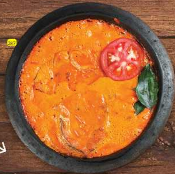
سمك شاتي كاري FISH CHATTY CURRY (Kingfish, Avoli, hamour, Sherri, Prawns)