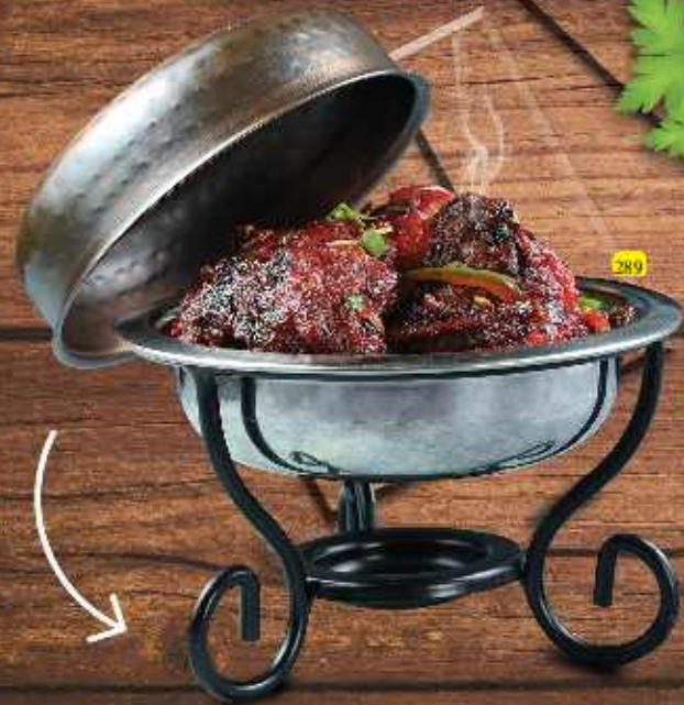
مباشر خاص مقلي MUBASHER SP. FRY