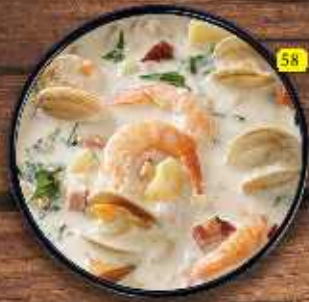
شوربة بحرية Seafood Soup DHS. 14