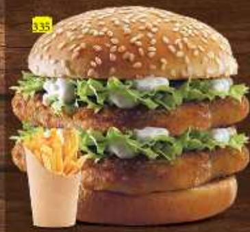
دبل برجر دجاج افخاذ CHICKEN THIGHS DOUBLE BURGER DHS. 16