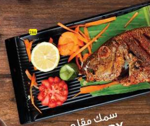
سمك مقلي FISH FRY

Never underestimate the power of good food. Eating delicious Food Can be a Life Changing Experience Shon Mehta