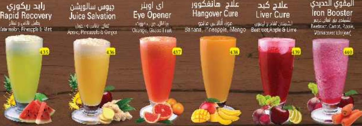
رابد ريكوري Rapid Recovery DHS. 12/14 جوس سالوشن Juice Salvation اي اوپنر Eye Opener علاج هانفكوير Hangover Cure علاج كبد Liver Cure المقوي الحديدي Iron Booster