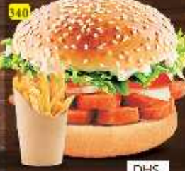
برجر نقانق HOTDOG BURGER DHS. 12