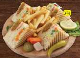
كلوب خضار Vegetable Club DHS 12