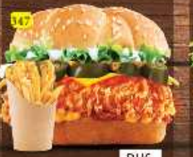
برجر مطافئ MATHAFI BURGER DHS. 14