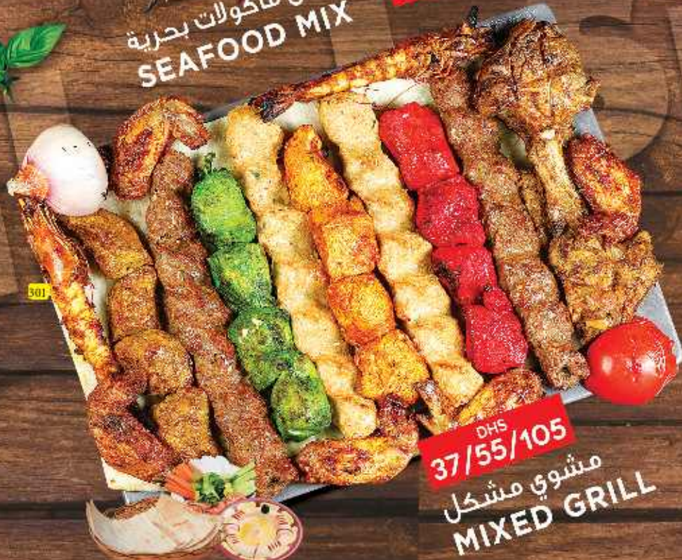
301 مشوي مشكل MIXED GRILL