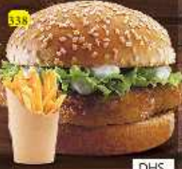
برجر خليج KHALEEJ BURGER DHS. 12