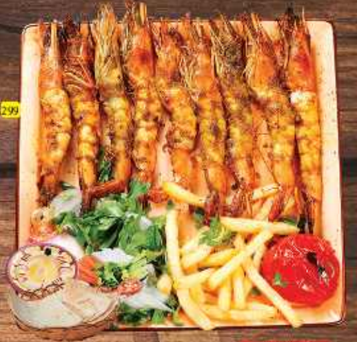
299 روبيان مشوي GRILLED PRAWNS