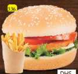
برجر دجاج مباشر MUBASHER CHI. BURGER DHS. 12