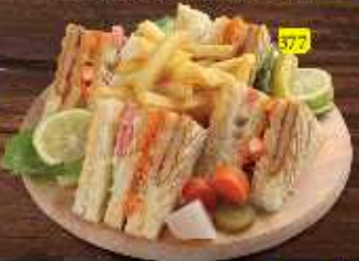
كلوب تندوري Tandoori Club DHS 12