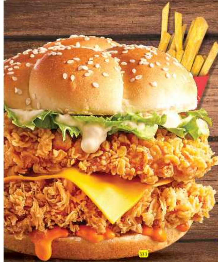
زنجر خاص مع جبن ZINGER SP. WITH CHEESE DHS. 16