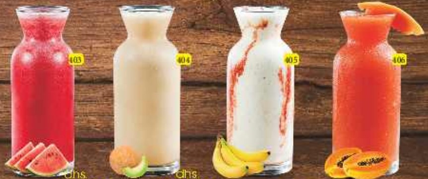
بطيخ dhs 6/8/10 WATERMELON شممام dhs 8/10/12 SWEET MELON موز dhs 6/8/10 BANANA بابايا dhs 10/12 PAPAYA