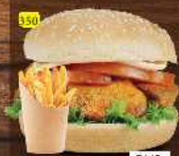
برجر دجاج تكا CHI. TIKKA BURGER DHS. 12