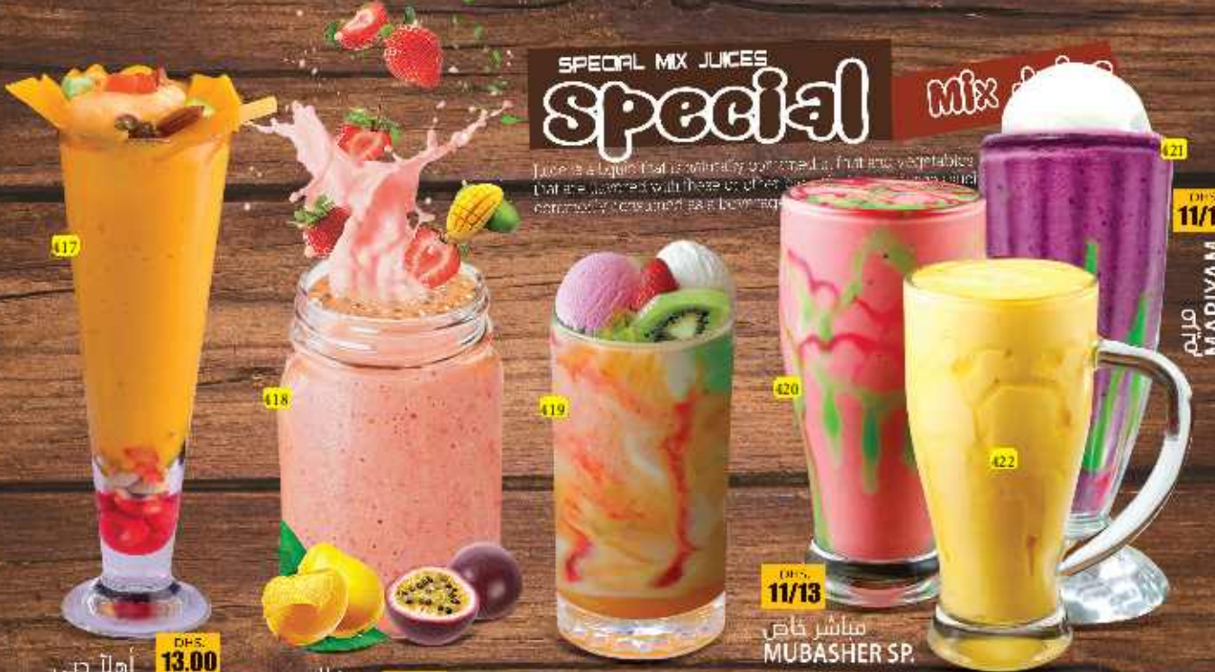
أهلا دبي AHLAN DUBAI DHS. 13.00 فالق FALAK DHS. 13/16 اسماعيل مطر ISMAIL MATHAR DHS. 13.00 مباشر خاص MUBASHER SP. DHS. 11/13 عبود ABOOD DHS. 11/13

Juice is a liquid that is primarily composed of fruit and vegetables that are blended with these or other natural or naturally occurring safe beverages.