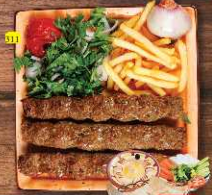
311 كباب لحم MUTTON KABAB