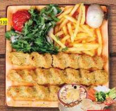
310 كباب دجاج CHICKEN KABAB