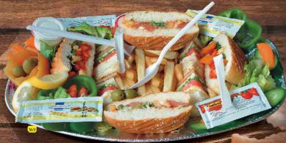
كلوب عائلة Family Club DHS 36.00

A sandwich is a food item consisting of one or more slices of bread, such as vegetable slices, cubes of meat, cheese or other fillings, slices of tomato, lettuce, pickles, etc. usually served with a sauce or dressing.