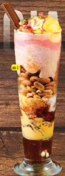
161 Royal Fantasy DHS. 17.00