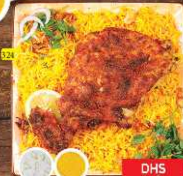
برياتي الفحم CHARCOAL BIRYANI DHS 15/18