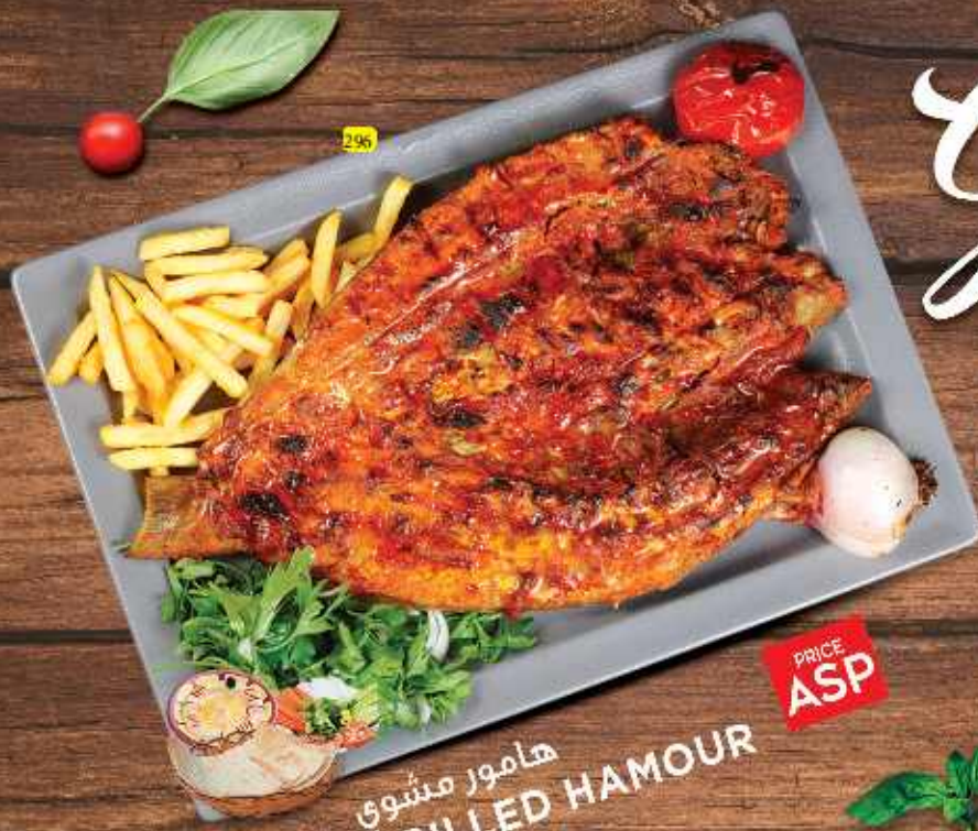
296 هامور مشوي GRILLED HAMOUR