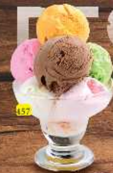
157 Mixed Ice Cream DHS. 8/10/13