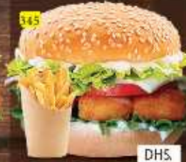
برجر قطع دجاج NUGGETS BURGER DHS. 10