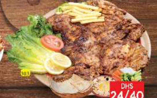
303 دجاج فلفل اسود على الفحم PEPPER CHARCOAL