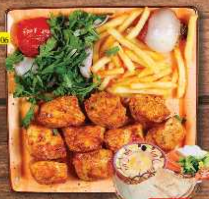
306 دجاج تكا CHICKEN TIKKA