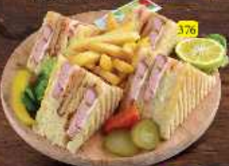
كلوب نقانق Hot Dog Club DHS 12