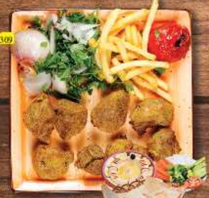
309 لحم تكا MUTTON TIKKA