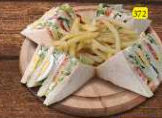
كلوب بيض Egg Club DHS 12