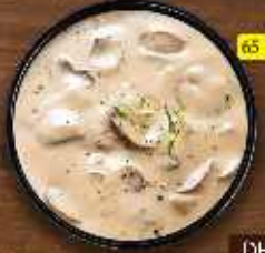
كريم فطر Cream of Mushroom DHS. 12