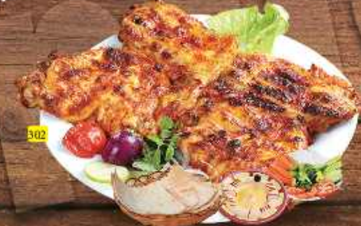
302 دجاج عادي على الفحم CHICKEN CHARCOAL