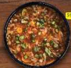
شوربة حار و حامض (دجاج/خضار) Hot & Sour Soup (Chi./Veg.) DHS. 10