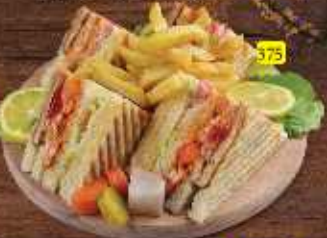
كلوب خاص Club Special DHS 12