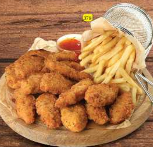
قطع دجاج CHICKEN NUGGETS DHS 12