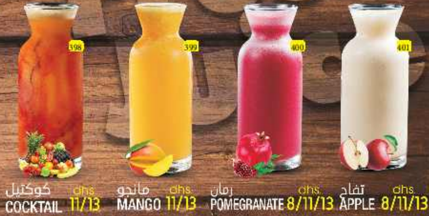
كوكتيل dhs 11/13 COCKTAIL مانجو dhs 11/13 MANGO رمان dhs 8/11/13 POMEGRANATE تفاح dhs 8/11/13 APPLE