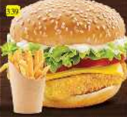
برجر سمك FISH BURGER DHS. 12