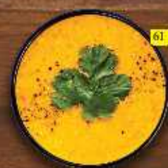
شوربة عدس Lentle Soup DHS. 13