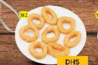
حلقات بصل ONION RINGS DHS 9/12