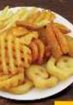
بطاطا مشكل MIX POTATO DHS 12