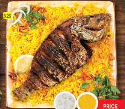
سمك مقلي مع أرز FRIED FISH W. RICE PRICE ASP