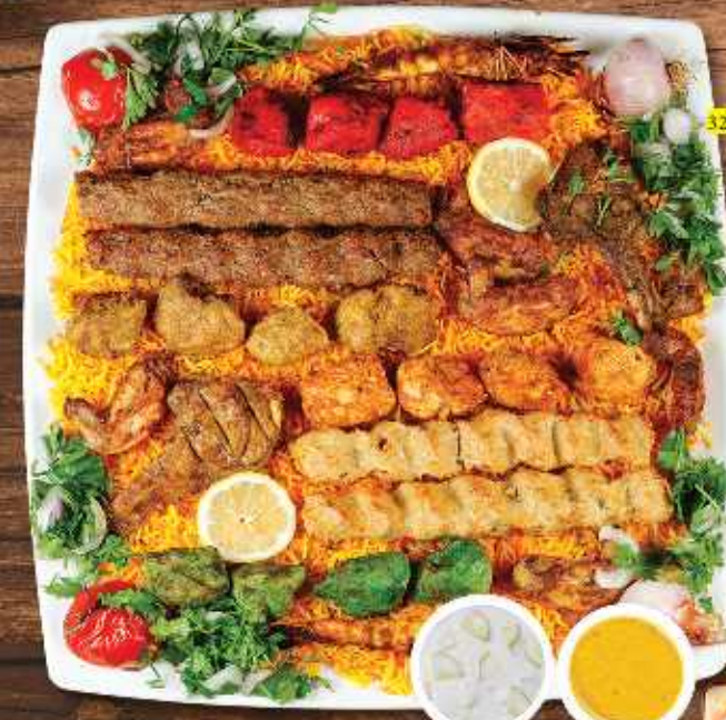
مشوي مشكل مع أرز MIX GRILL WITH RICE DHS 50/75/120