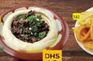
حمص مع لحم HAMMUS W. MEAT DHS 12