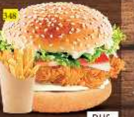
برجر كنتاكي KENTUCKY BURGER DHS. 14