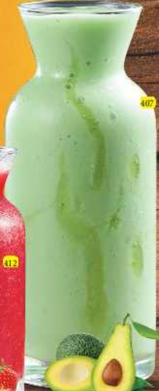
dhs. 9/11/13 افوكادو AVOCADO