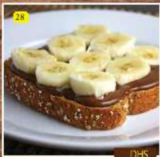
28 NUTELLA & BANANA DHS. 8.00