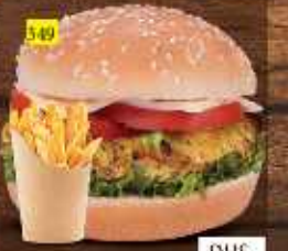
برجر دجاج ليمون CHI. LEMON BURGER DHS. 12