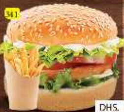
برجر لحم بقرة/ دجاج CHI./BEEF BURGER DHS. 8