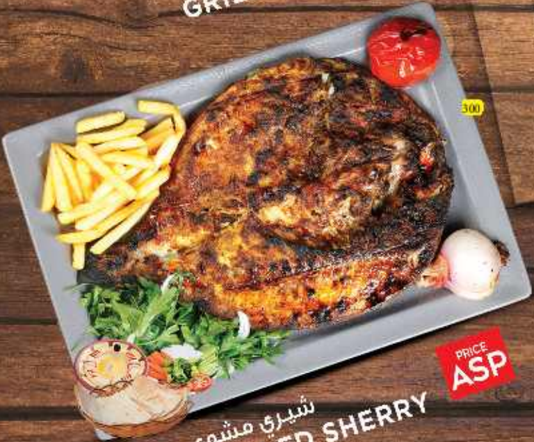
300 شيري مشوي GRILLED SHERRY