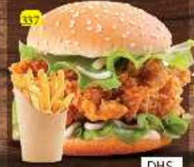
برجر زنجر ZINGER BURGER DHS. 13