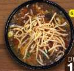
شوربة مانشو (دجاج/خضار) Manchow Soup (Chi./Veg.) DHS. 10